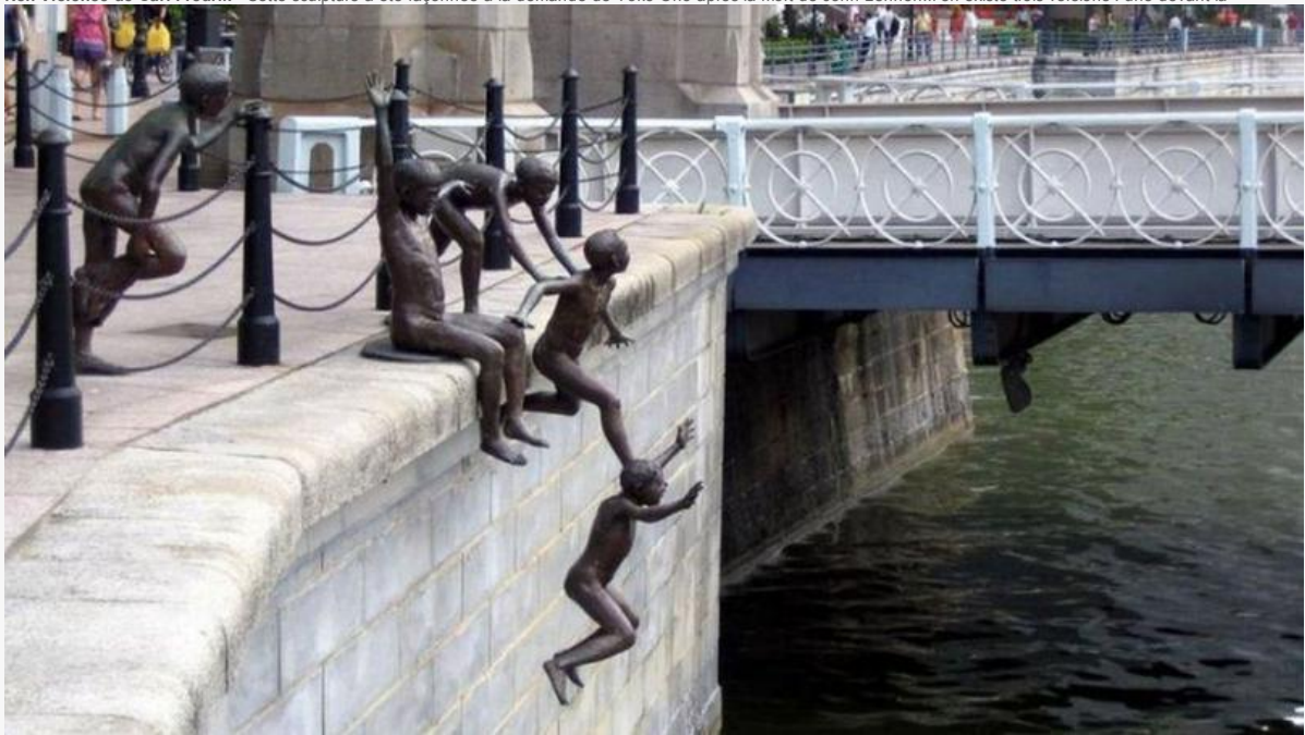
The First Generation de Chong Fah Cheong - Le sculpteur de Singapour a fini son œuvre qui se situe sur le pont Cavenagh, en décembre 2000. Crédits photo : Chong Fah Cheong