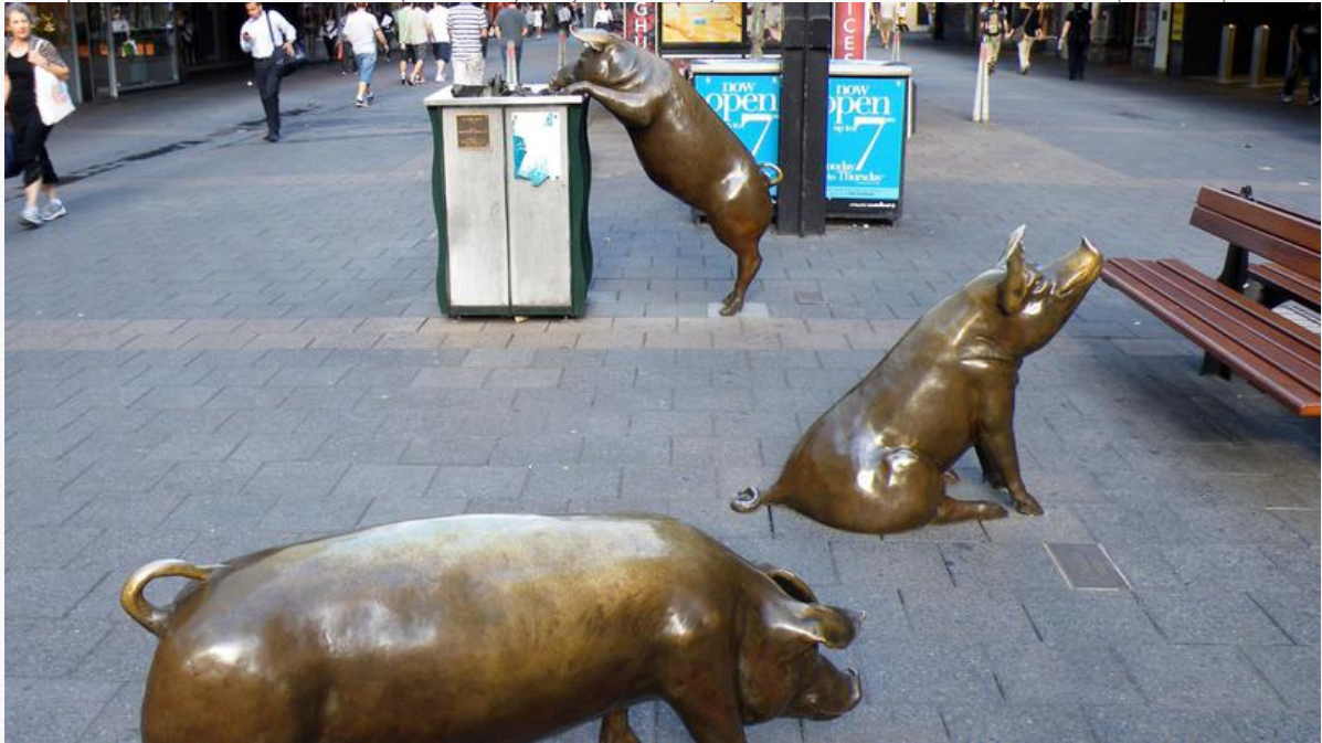
A Day Out de Marguerite Derricourt - Voici Olivier (qui renifle la poubelle), Truffles (au premier plan) et à droite, Horatio. Ces trois cochons (il y en a quatre en tout) sont l'une des attractions du Rundle Mall, le premier centre commercial d'Australie du Sud. C'est la ville qui a demandé à Marguerite Derricourt de venir décorer le lieu. Par la suite, la mairie a lancé une compétition pour nommer les cochons. Sinon, les locaux les appellent « les cochons du Rundle Mall », tout simplement.