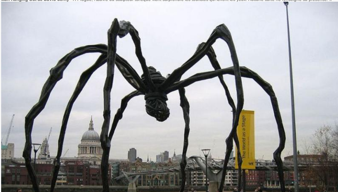
Maman de Louise Bourgeois - Cette immense sculpture en acier inoxydable haute de dix mètres fut commandée par la Tate Modern, à Londres. Pour la plasticienne décédée en 2010, cette œuvre était un hommage à sa mère: «L'araignée est une ode à ma mère. Elle était ma meilleure amie. Comme une araignée, ma mère était une tisserande. Les araignées sont des présences amicales [...] les araignées sont bénéfiques et protectrices, comme ma mère. » Crédits photo : Louise Bourgeois