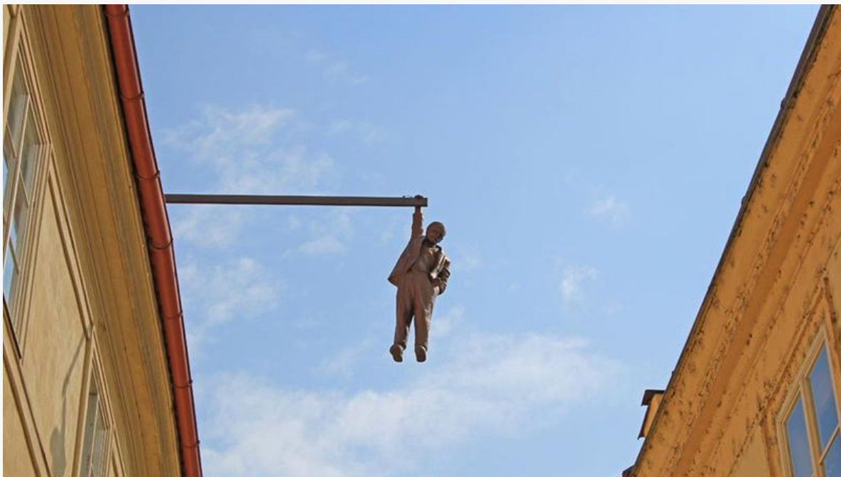
Man Hanging Out de David Cerny - À Prague, l'œuvre du sculpteur tchèque vient surprendre les touristes qui lèvent les yeux. Aucune carte ne renseigne sa présence. Il