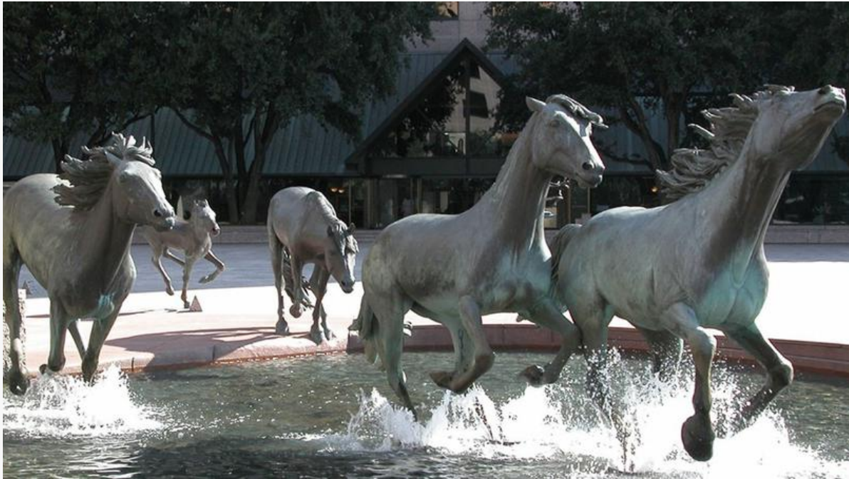
Mustangs at las Colinas de Robert Glen - La plus grande sculpture équestre du monde réside à Irving, au Texas. Elle représente les emblématiques chevaux, montures fidèles des pionniers américains. À échelle 1,5 de la réalité, les chevaux sont figés en pleine course. Pour s'approcher le plus possible du trompe-l'œil, le sculpteur a également fixé l'eau des éclaboussures provoquées par la foulée des Mustangs.

EN IMAGES ou simples créations visuelles surprenantes, la diversité du monde des sculptures promet de belles surprises.