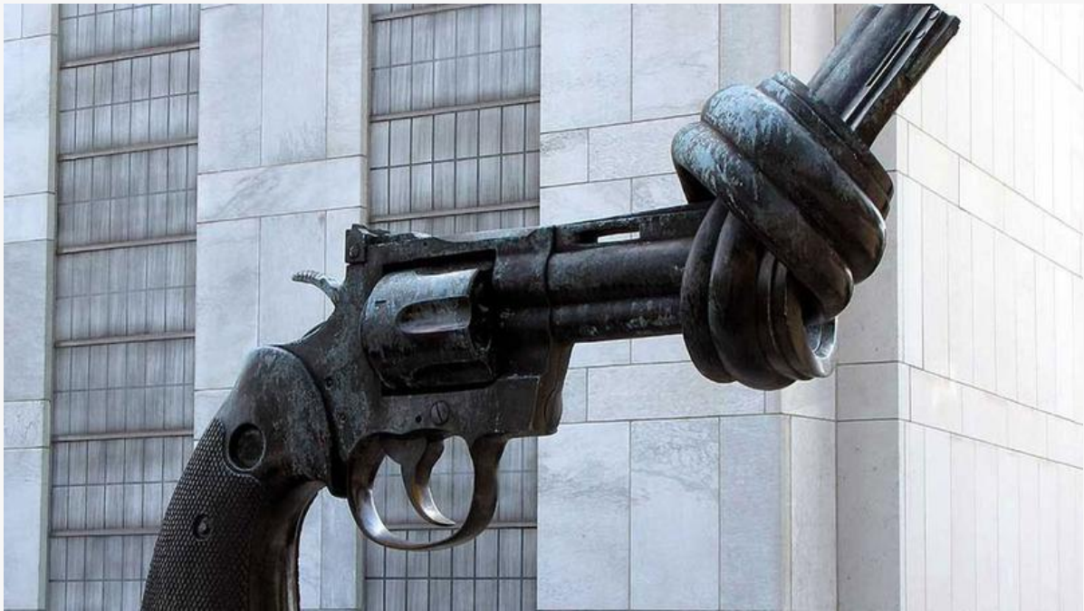
Non-Violence de Carl Fredrik - Cette sculpture a été façonnée à la demande de Yoko Ono après la mort de John Lennon. Il en existe trois versions : une devant la